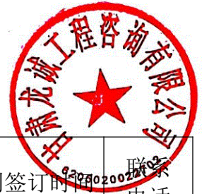
类似服务业绩一览表