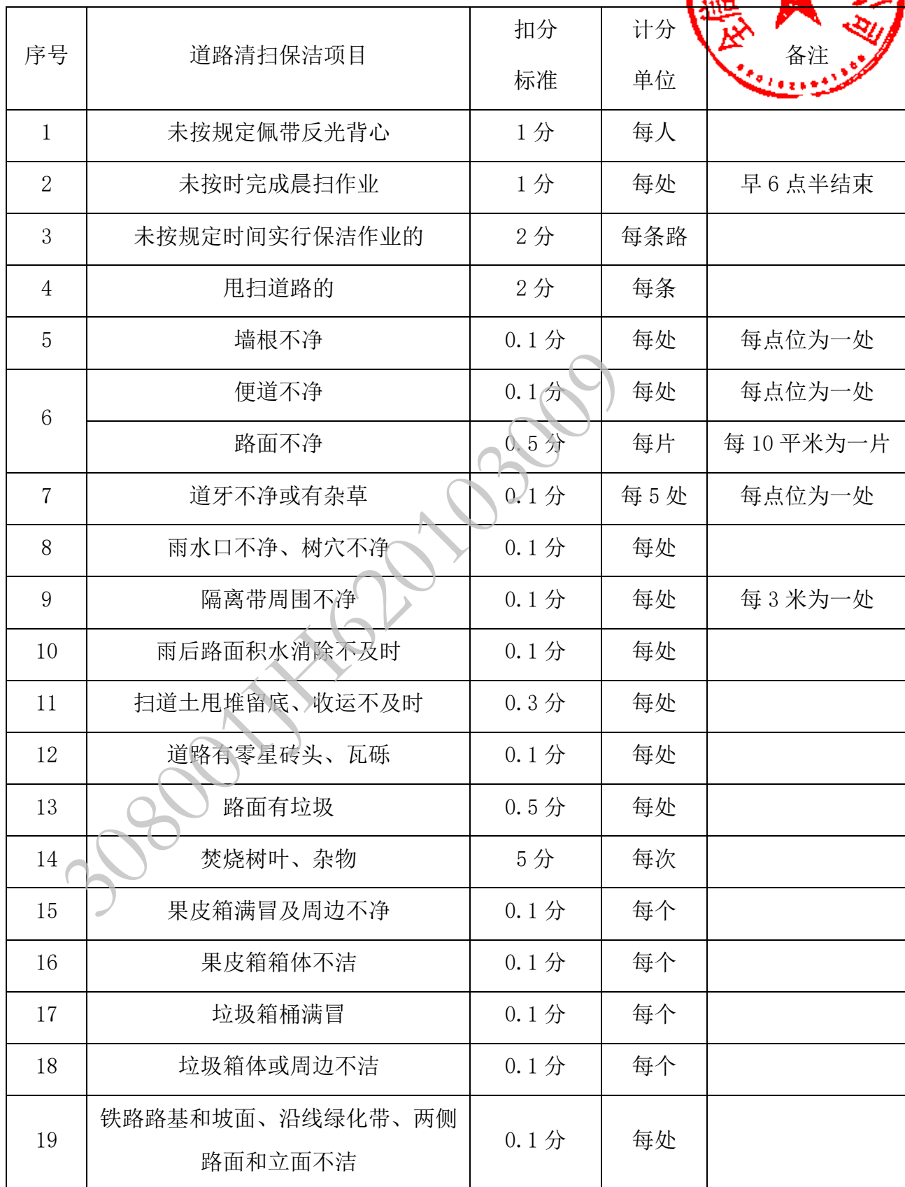
附表 1 道路扫保质量检查扣分标准