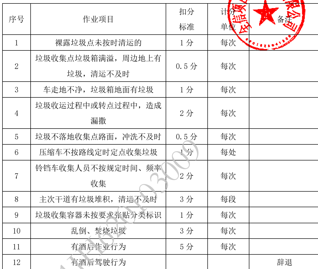
附表 3 垃圾清运扣分标准