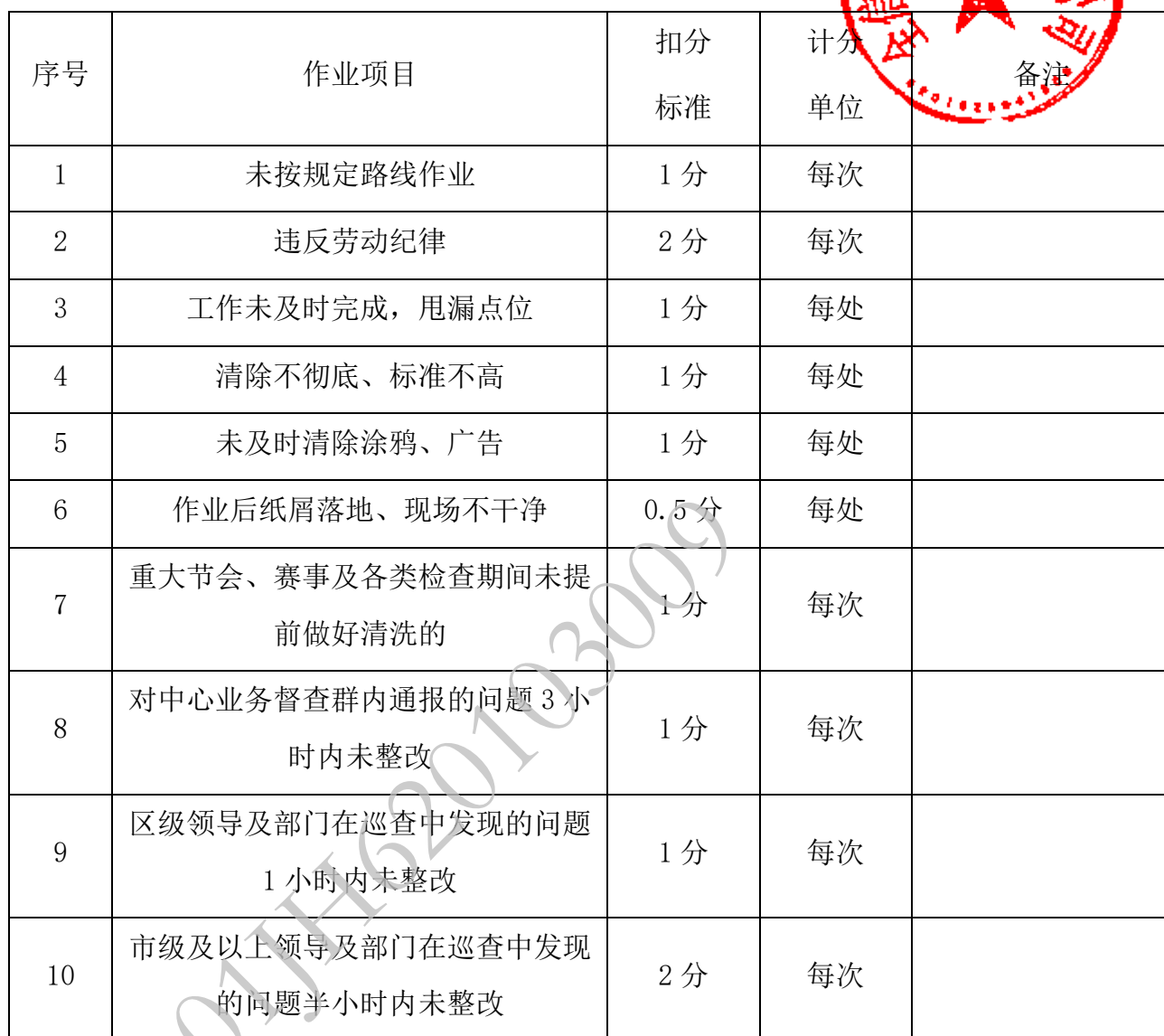
附表 4 小广告清理作业扣分标准