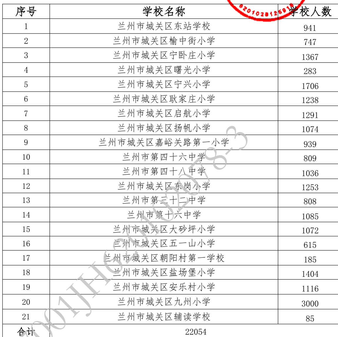
城关区学生视力监测人数统计表（第三包）